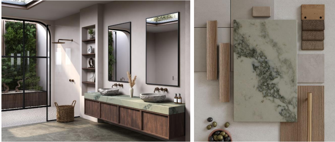
8477 Ocean Sage