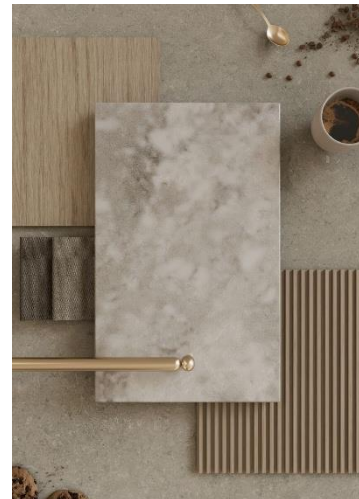
8451 Wild Storm